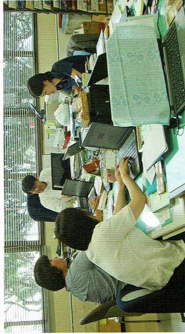
事務室 手話通訳者が常動しています。