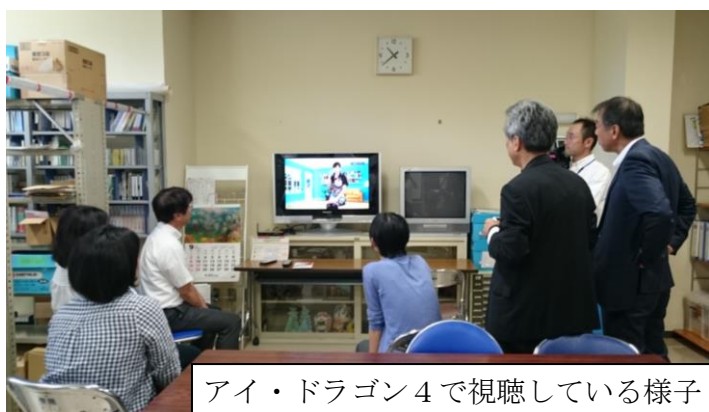
アイ・ドラゴン4で視聴している様子