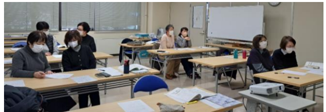
ペアになって難聴者役と筆記役

3月11日(土)に要約筆記者の現任研修を開催しました。これまで報告書等から「資料の活用」の学習の必要性を感じており、念願の研修でした。手書きとパソコンに分かれ講師がオンラインで登場する初めての方法で行いました。